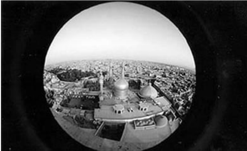
ព្រះបូជនីយចេតិយព្រះនាង ហ្វាទីម៉ាសុំ ម៉ាកុំស្លៀម៉ាសុំ صلوات الله عليها

ពិតណាស់ ព្រះនាង صلوات الله عليها ប្រកបដោយកម្រិតធម៌ខ្ពស់ណាស់ អាស្រ័យហេតុនេះ ព្រះរៀម صلوات الله عليه والسلام ព្រះនាង صلوات الله عليها បានលើកឋាននូវស័ក្តិឲ្យព្រះនាង صلوات الله عليها ថា ម៉ាកុំស្លៀម៉ាសុំ (អរិរុទ្ធបុគ្គល) ។ នេះគឺថាមនាការកំពូលមួយមកពីអ៊ីម៉ាំ صلوات الله عليه والسلام ។