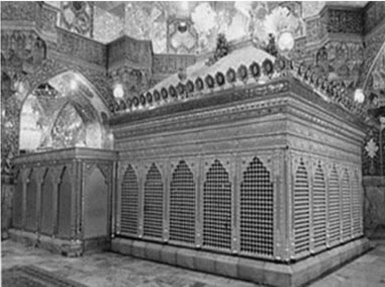
បន្ទប់ចាស់ជុំវិញព្រះរាជផ្នូរព្រះនាង ហ្វឺត្រូវោះត្តិ ម៉ាកុំស្វីម៉ាស្ត្រី عليه السلام

ក្នុងឆ្នាំ ១២៣០ សករាជហ្វឺត្រូវោះត្តិ (ឆ្នាំសាកល ១៨១៥) ស្តេច ហ្វាត់ហ្វី អុលី ស្វាស្ត្រី ក្លីយ៉ាវ ពាសរនាំងដែកនេះដោយប្រាក់ ។ រនាំងនេះនៅរហូតដល់ខូច ។ ក្នុងឆ្នាំ ១២៨០ សករាជហ្វឺត្រូវោះត្តិ (ឆ្នាំសាកល ១៨៦៤) បន្ទប់ថ្មីត្រូវបានសាង ឡើងដោយយកប្រាក់ពីបន្ទប់ចាស់មកប្រើ និងដោយបន្ថែមប្រាក់ពីរតនាគារ ។ បន្ទប់នេះជាជំនួសបន្ទប់ចាស់ទាំងអស់ ។