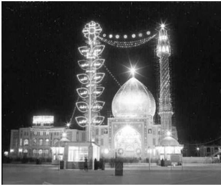
ម៉ាស់យ៉ុដូ យ៉ុកាន់ (مسجد جمران)

អាយ៉ាទូលឡោះហ្គាំ សែយីដូ ស្វាហ្គាប់ អាល់-ខ្លីន អាល់-ម៉ារអុស្តី អាល់-ណាយ៉ុហ្គី (កើតឆ្នាំ ១៣១៥ ស.ហ្គ./ឆ្នាំសាកល ១៨៩៨ , អនិច្ចកម្មឆ្នាំ ១៤១១ ស.ហ្គ./ឆ្នាំសាកល ១៩៩១) បានសរសេរថា៖ "ម៉ាស់យ៉ុដូនេះត្រូវបានសាងសង់ឡើងដើមកុយបាស់... ។ ៨ គេបានឃើញអ៊ីម៉ា អាល់-ម៉ាស្តុន្ទី عجل الله فرجه ឥតខាននៅឯម៉ាស់យ៉ុដូនេះតាំងពីពេលនោះមក... ។ ស្តែខ្ញុំ ស្តែខ្ពុកូ (الشيخ الصدوق) បានពង្រីកម៉ាស់យ៉ុដូនេះ ។ សម័យរជ្ជកាលស្តេចត្រកូលស្ត្រីហ្វារី គេបានជួសជុលម៉ាស់យ៉ុដូនេះច្រើនដង... ។ ខ្ញុំបានឃើញផ្ទាល់ភ្នែកនូវអព្វតហេតុអស្ចារ្យនៅឯម៉ាស់យ៉ុដូនេះ... ។ និយាយឲ្យខ្លី ទីនេះពិតជាកន្លែងមួយដែលអ៊ីម៉ា ម៉ាស្តុន្ទី عجل الله فرجه ទៅមកញឹកញយ ។ បន្ទាប់ ម៉ាស់យ៉ុដូ សាស្ត្រាស្ត្រ (مسجد السهلة) នៃទីក្រុងគូហ្វាស្តុ ម៉ាស់យ៉ុដូនេះជាកន្លែងមួយដែលគេអាចឃើញអ៊ីម៉ា ម៉ាស្តុន្ទី عجل الله فرجه ។" ៩ ម៉ាស់យ៉ុដូនេះស្ថិតនៅឆ្ងាយពីទីក្រុងគូម ៦ គីឡូម៉ែត្រ នៅទិសខាងត្បូងឆៀងកើត ។ មនុស្សកុះករទៅកាន់ម៉ាស់យ៉ុដូនេះ ជាពិសេសរាល់យប់ថ្ងៃអង្គារ ។ យោលតាមសេចក្តីរាយការណ៍ច្រើន នេះគឺយប់ដែលអ៊ីម៉ា عجل الله فرجه មកកាន់ម៉ាស់យ៉ុដូនេះ ។