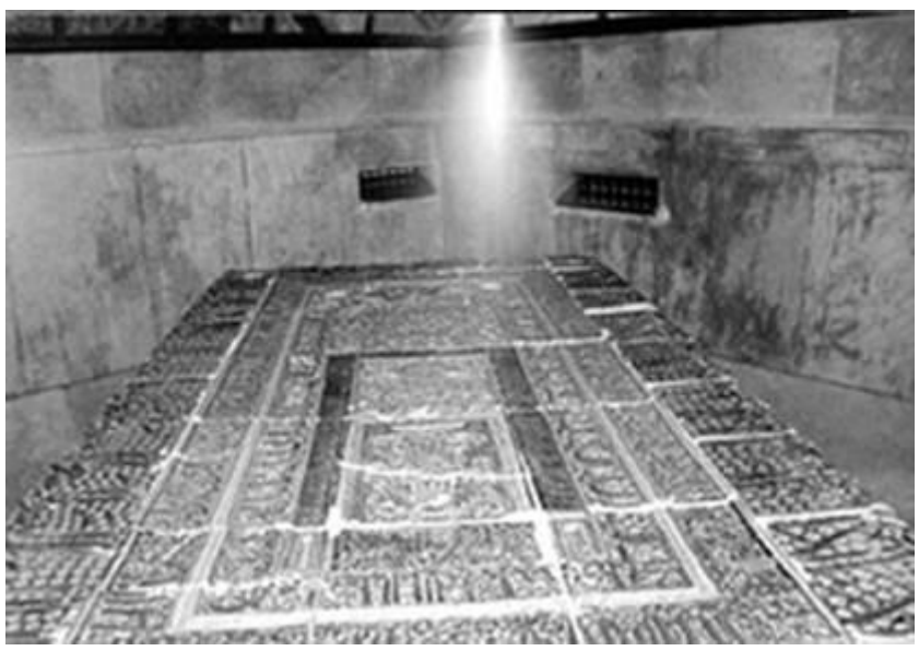
ព្រះរាជផ្នូរព្រះនាង ហ្វាទ្វីម៉ាស៊ូ ម៉ាក្លុស្វីម៉ាស៊ូ عليها السلام

នៅពីក្រោមចំណារ មានចារជាអក្សរធ្មង់ក្បាច់ ណាស់ខ្ញុំ (سخ) ថា៖ "សរសេរនិង ឆ្លាក់អក្សរដោយមូហាំម៉ាដ្ឋ អ៊ីបនូ អាបី ត្ថុហ្វៀរ អ៊ីបនូ អាបី អាល់-ហ្វ្លៃស៊ីន ។"