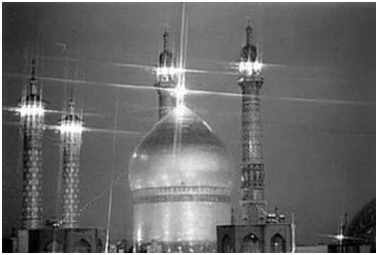
ដោយលើព្រះបូជនីយដ្ឋានព្រះនាង ហ្វាទ្វីម៉ាស្ត់ ម៉ាក្តុស្វីម៉ាស្ត់ عليها السلام

"ការពិតអស់ឡោះហ្វី رحمته បានហាមផែនដីប៉ះពាល់សាច់យើង عليهم السلام ។ ឡើយ ។" 20