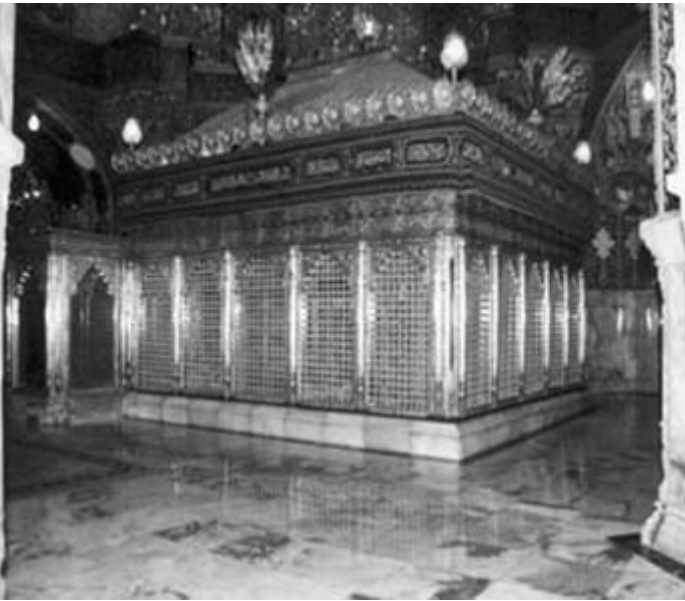
បន្ទប់ (ضريح) ថ្មីជុំវិញព្រះរាជផ្នូរព្រះនាង ហ្វូឡីម៉ាស៊ូ ម៉ាកុំស្ត្រីម៉ាស៊ូ عليها السلام

លោកអ្នកថែរក្សាព្រះពូជនីយចេតិយ អាយ៉ាទូលឡោះហ្វី ម៉ាស៊ូឡីឡី បានសម្រេចចិត្តផ្លាស់បន្ទប់បញ្ចុះព្រះ រាជសពក្នុងឆ្នាំ ១៤១៥ សករាជប្បវត្តរោងត្រី (ឆ្នាំ សាកល ១៩៩៥) ។ គេបានប្រគល់មុខការគួរឲ្យបន្ទប់ ថ្មីឲ្យទៅលោកអ្នកឯកទេស អាកុ ហ្វីសែនី ប៉ារវាវេស្ត អ៊ីស្ត្រាហ្វានី ។ លោកបានទទួលអនិច្ចកម្មមុនចប់ កិច្ចការ លោក អាកុ មូហ្វាម៉ាដូ ហ្វីសែនី អាប់បាស់ពូរ អ៊ីស្ត្រាហ្វានី បានបញ្ចប់កិច្ចសាងបន្ទប់ថ្មីនេះ ។