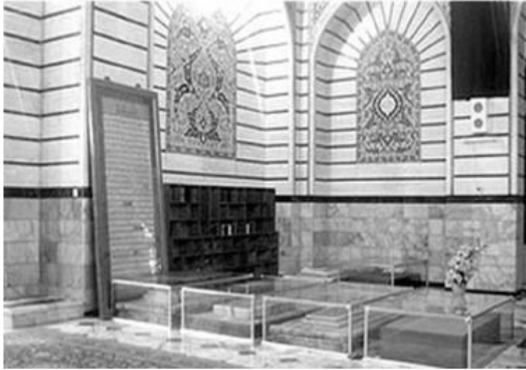
ផ្លូវរបស់អាយ៉ាទូលឡោះហ្គីនៅក្នុងម៉ាស៊ីន បាឡាសារ នៅក្នុងព្រះចេតិយព្រះនាង ហ្គាទ្វីម៉ាសូ ម៉ាក្កុស្វីម៉ាសូ عليها السلام