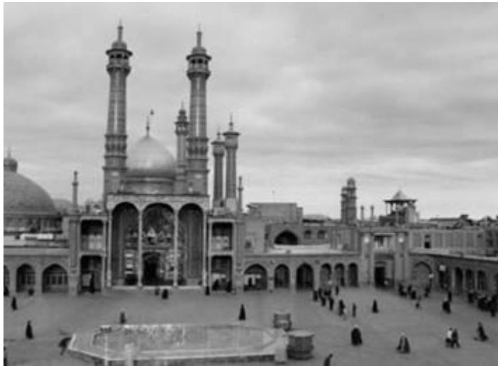
ទឹកដីស័ក្តិសិទ្ធិ - ព្រះបូជនីយដ្ឋានព្រះនាង ហ្វាទីម៉ាស៊ូ ម៉ាក្កុស្ត្រីម៉ាស៊ូ ﷺ

នេះគឺអព្វតហេតុអស្ចារ្យមួយ ក្នុងបណ្តាអព្វតហេតុអស្ចារ្យច្រើនទៀត ពុំអាចលើកយកអធិប្បាយទាំងអស់នៅក្នុងកូនភោជីតូចនេះបានទេ ។ ក៏ប៉ុន្តែអព្វតហេតុអស្ចារ្យដែលធំជាងអស់អព្វតហេតុនោះ គឺឥទ្ធិពលព្រះនាង ﷺ ដែលជះទៅលើទឹកដីក្នុងនេះដែលឈានដល់ដំណាក់កាល ដែលគេបានឃើញស្រាប់ហើយសព្វថ្ងៃនេះ ដោយសារវត្តមានព្រះនាង ﷺ ដោយសារការណែនាំ ដោយសារការជួយបណ្តុះចិត្តនិងព្រះពររបស់ព្រះនាង ﷺ ។